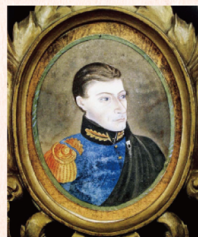
シーボルトの肖像画

文政11年(1828)、シーボルトは幕府禁制の地図を国外へ持ち出そうとして国外追放処分(シーボルト事件)となりますが、日本で収集した多くの標本類をオランダへと持ち帰りました。その中に、坂下で手に入れたオオサンショウウオ2匹も含まれていました。本国へ帰る船の中で、共食いにより1匹を失いますが、1匹はオランダにわたり、アムステルダムの動物園で飼育されて51年に及ぶ飼育記録を打ち立てました。また、シーボルトがライデン市にある国立自然史博物館の協力を得て出版した『日本動物誌(FAUNA JAPONICA)』(全5巻)には、この日本から持ち帰ったオオサンショウウオの図版が掲載されており、現在でもライデン博物館にはホルマリンにつけられた標本として保存されています。