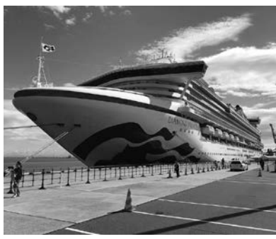
<ダイヤモンド・プリンセス>